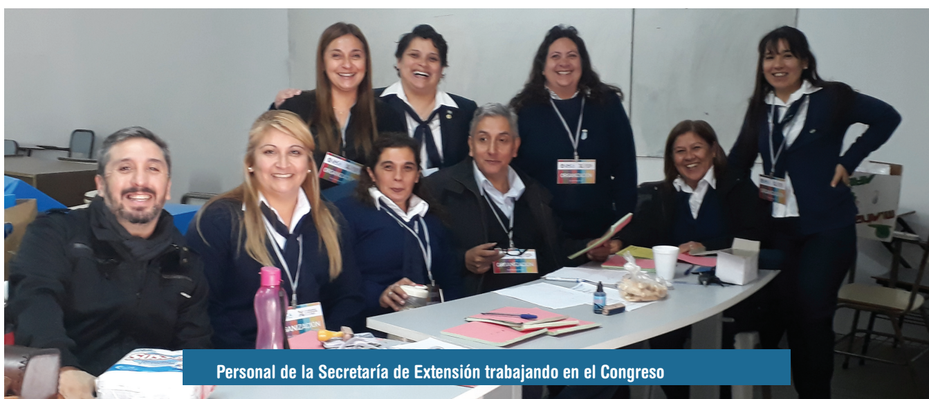
Personal de la Secretaría de Extensión trabajando en el Congreso